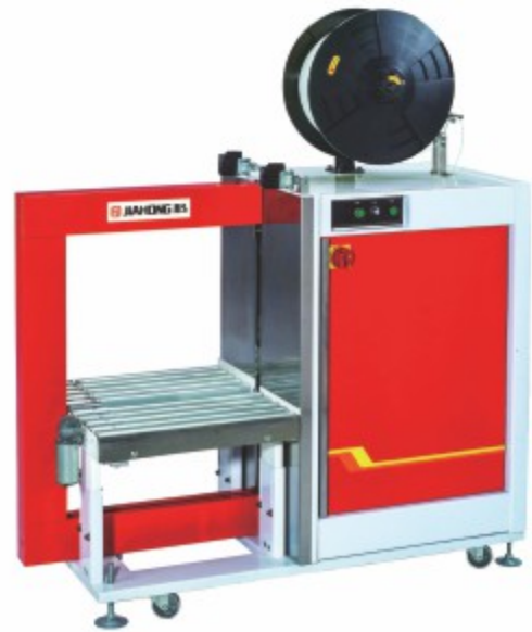
TP-601YA 全自动侧捆型打包机