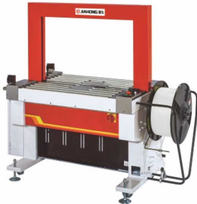
TP-601D 全自动无人化打包机 (滚筒传动)