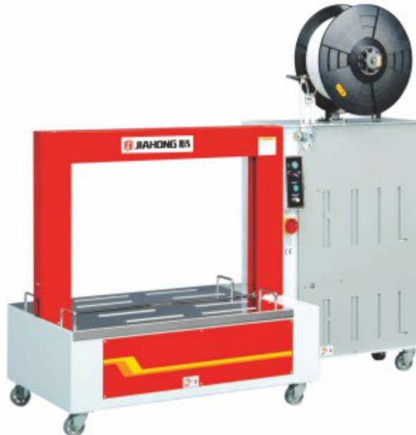
TP-601L 低台全自动打包机