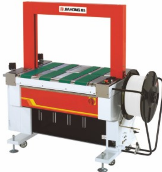
TP-601D 全自动无人化打包机 (皮带传动)