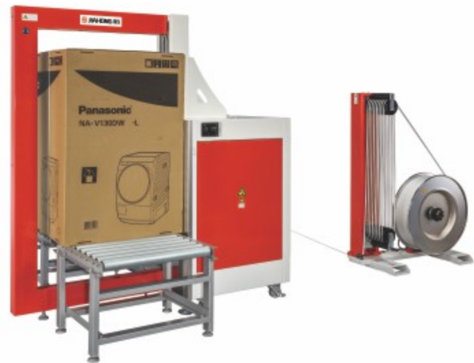
TP-601YPT 全自动侧捆型打包机