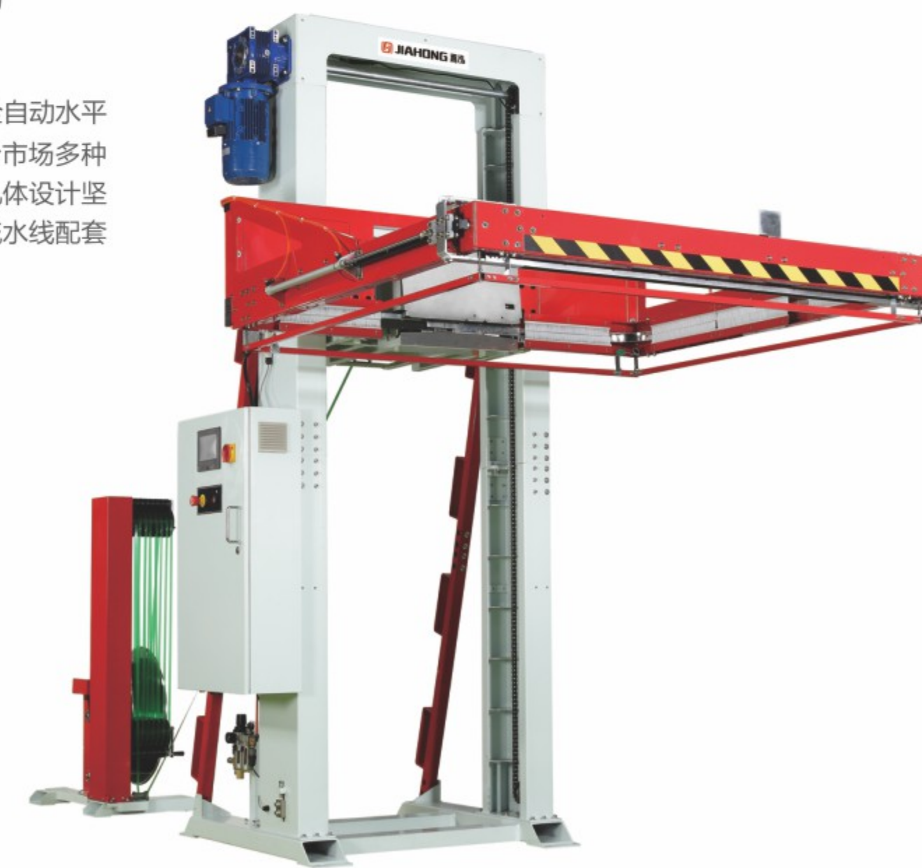
TP-713H Castor II