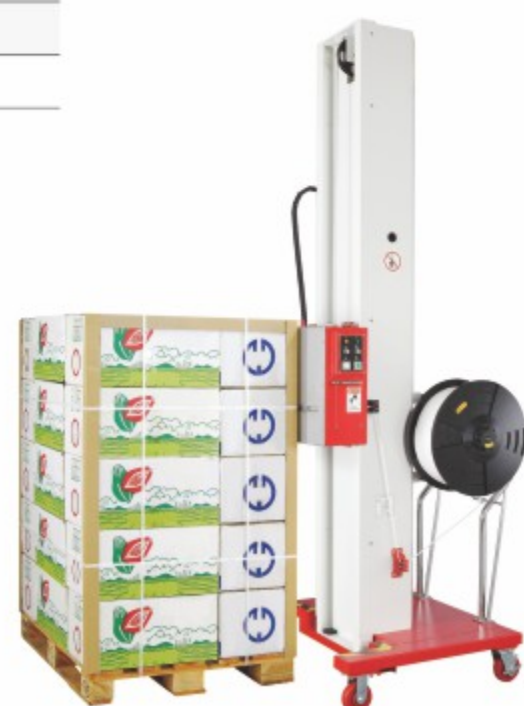
TP-502MH 半自动水平打包机