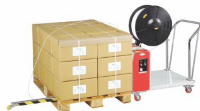
TP-502MV 半自动穿箭式打包机