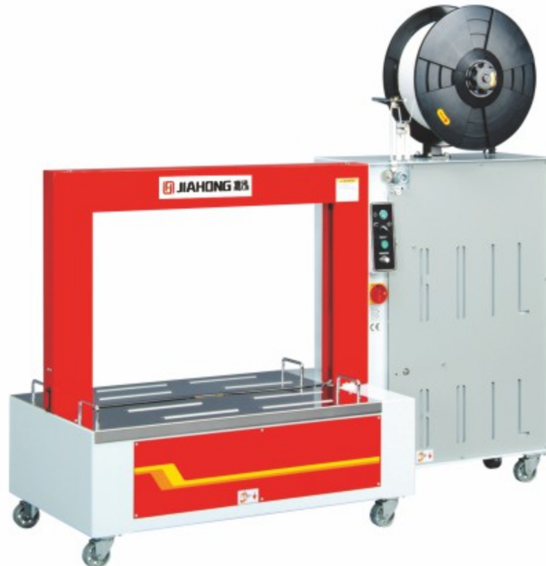
TP-601L 低台全自动打包机