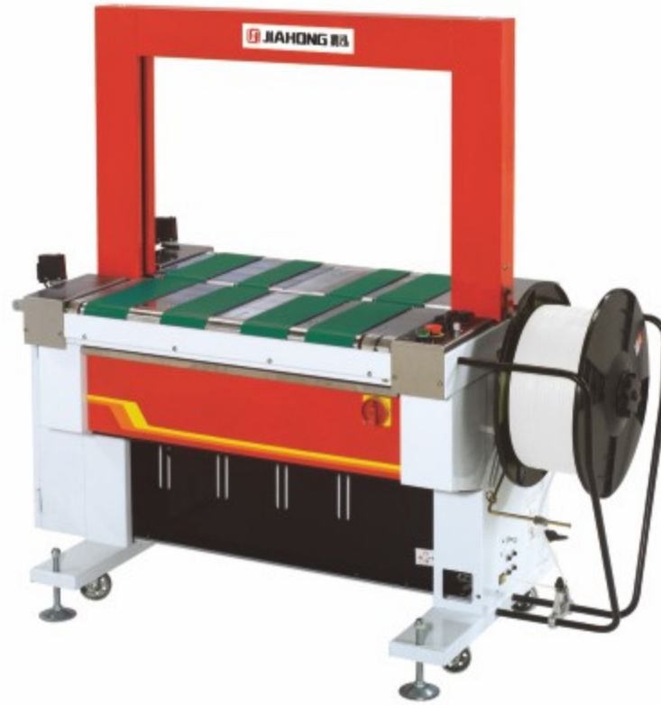
TP-601D 全自动无人化打包机 (皮带传动)